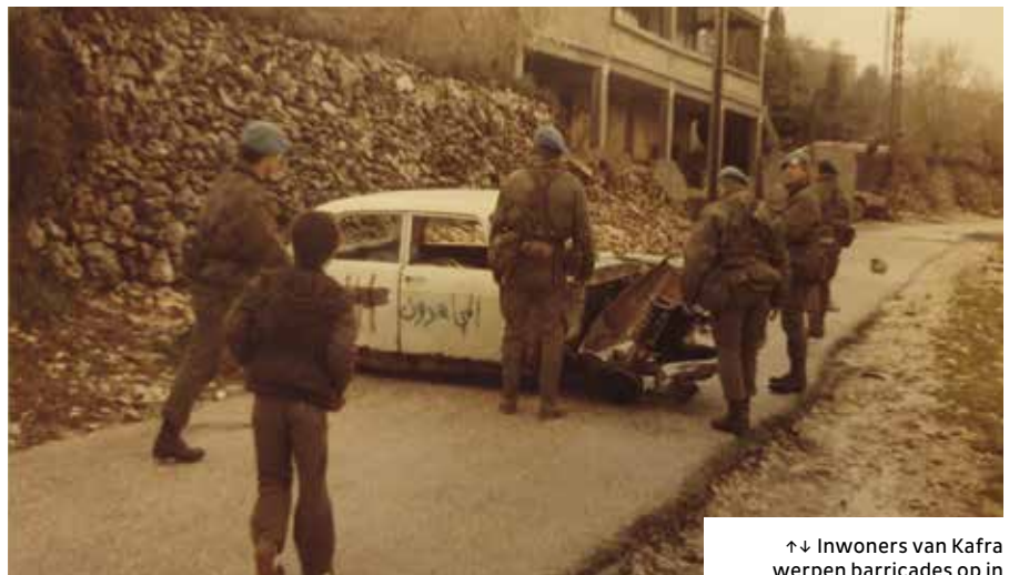
↑↓ Inwoners van Kafra werpen barricades op in maart 1983 bij het vertrek van Nederlandse Unifillers.