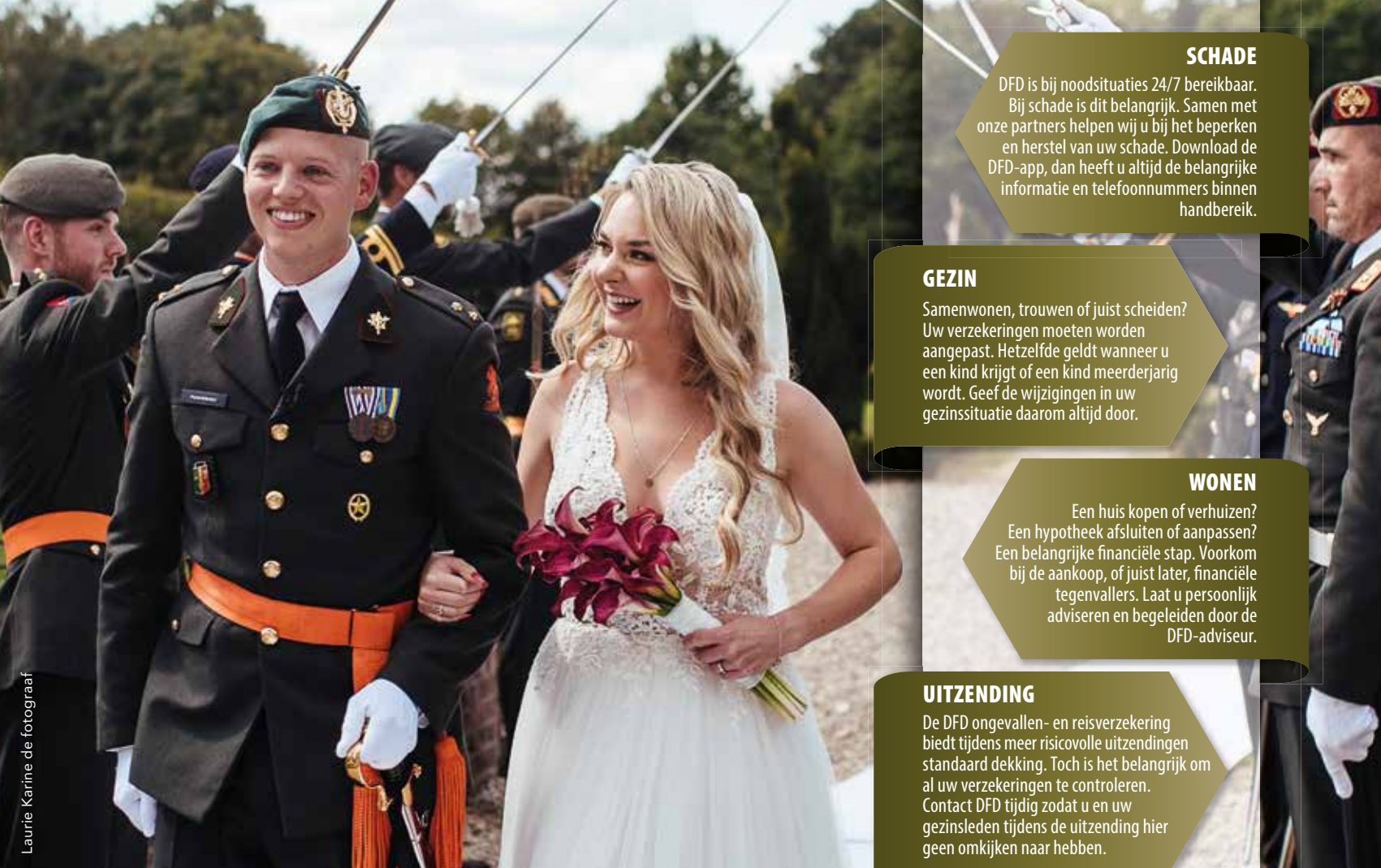
Laurie Karine de fotograaf