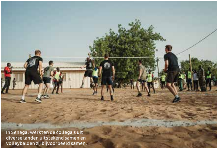
In Senegal werkten de collega's uit diverse landen uitstekend samen en volleybalden zij bijvoorbeeld samen.