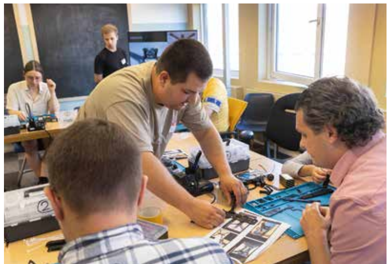
→ De workshop drones bouwen in Utrecht.

Galgan is een van de vele gewonde Oekraïense militairen die in Nederland in het MRC een revalidatietraject aangeboden krijgen. Volgens hem hebben de veteranen onderling veel steun aan elkaar. “We trekken veel samen op. We sporten daar ook, zelfs voetballen en zwemmen, want er zijn zoveel prima faciliteiten.”